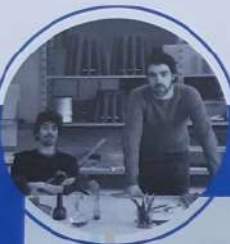
Des étagères offrant deux positions en toute flexibilité. 'Display' du duo Amorce. amorcestudio.com