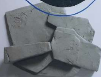
Après une expo remarquable l'an passé sur le thème du charbon, le collectif Brut revient avec le thème du sol